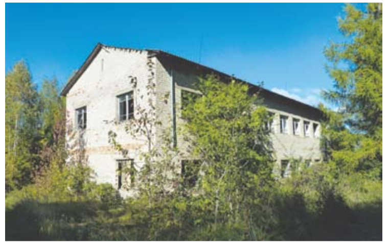
Jau dvidešimt metų buvusios Kunigiškių mokyklos pastatas yra nenaudojamas.