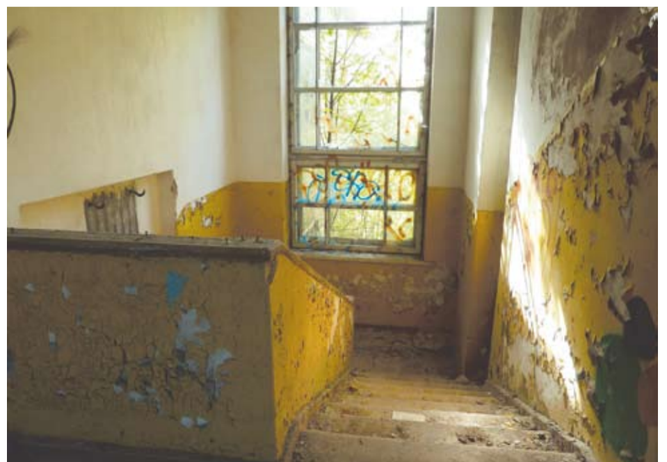
Buvusios Kunigiškių mokyklos pastatas yra privati nuosavybė. Tačiau maža vilčių, kad jo savininkai bandys pastatą prikelti naujam gyvenimui.