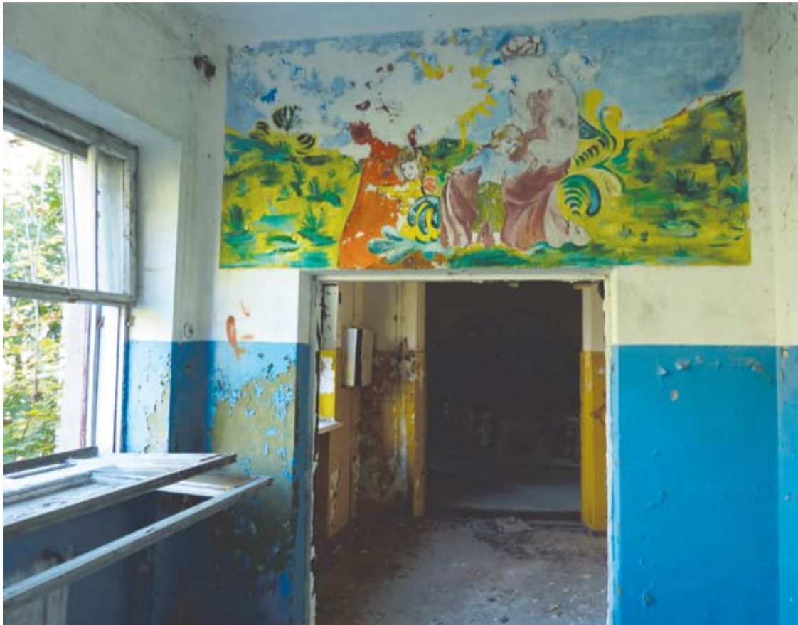
Ant sienos dar išlikęs piešinys iš tų laikų, kai mokykloje klegėjo vaikai.