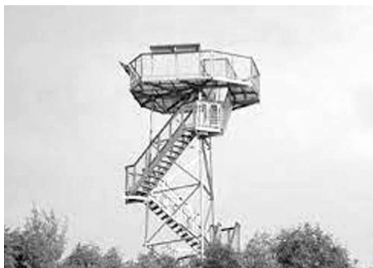
Bijeikių apžvalgos bokšto atnaujinimas kainuos per 29 tūkst. Eur.

15 metrų aukščio Bijeikių apžvalgos bokštas stovi ant kalvos, siekiančios 163 m aukštį virš jūros lygio, lankytojams prieš akis atsiveria vaizdinga panorama. Nuo apžvalgos bokšto galima grožėtis Anykščių apylinkių kraštovaizdžiu, Rubikių ežeru su 16 salų, Bijeikių piliakalniui.