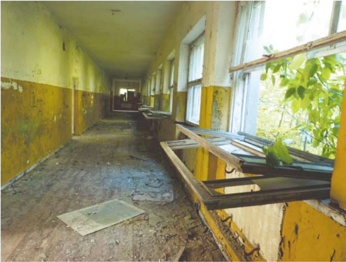
Kažkas jautė pareigą išdaužyti ar bent atidaryti visus mokyklos langus.