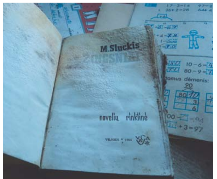
Tarybinio rašytojo Mykolo Sluckio rinktinė ir pradinuko matematikos sąsiuvinis.