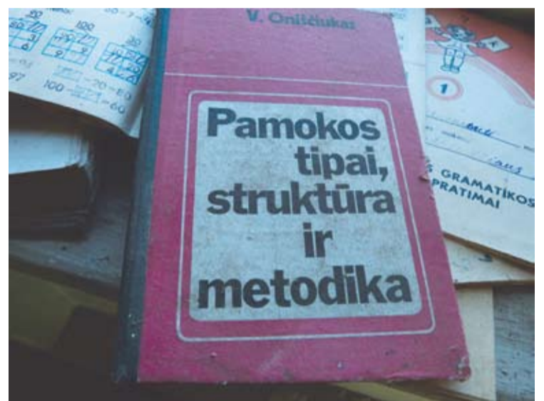
Kunigiškių mokykloje devintame praėjusio amžiaus dešimtmetyje mokėsi 70-80 mokinių.