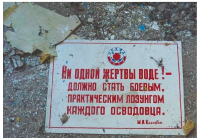
„Nė vienos aukos vandenyje!“ - Kunigiškių mokyklai tinkamas šūkis, mat jos rūšį dažnai užliedavo vanduo.